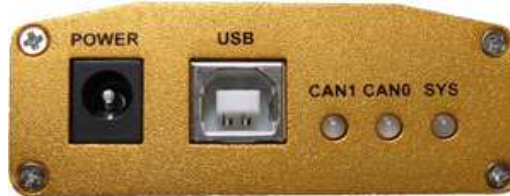
图 2-1 ACUSB 的 USB 端口图