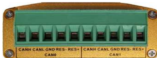
图 2-2 ACUSB 的 CAN 端口图

如图 2-2 所示，ACUSB 卡的 CAN 端口采用 OPEN 10 的螺丝压紧接线方式，端口功能描述如下：